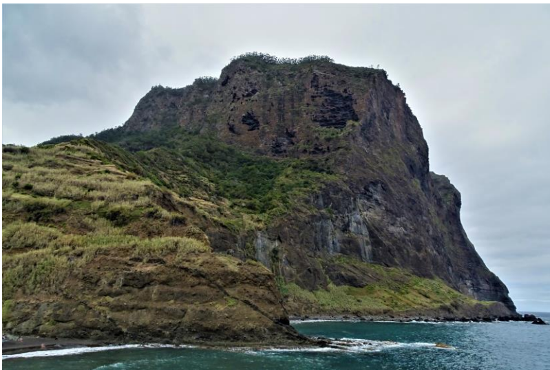
Îlot de Baixa de Fora À Porta Da Cruz

Fin de cette première journée de rando et retour à Funchal pour un repos bien mérité !!!!!